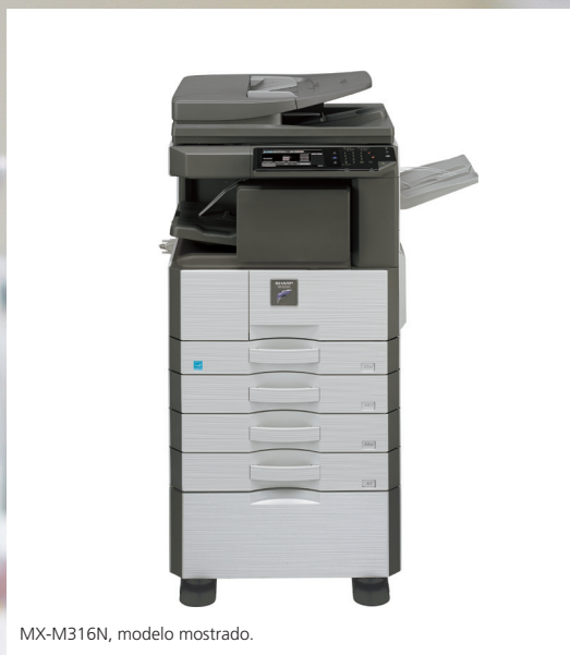
MX-M316N, modelo mostrado.

SISTEMA MULTIFUNCIONAL A3 BLANCO Y NEGRO CON DISEÑO FLEXIBLE PREPARADO PARA RED